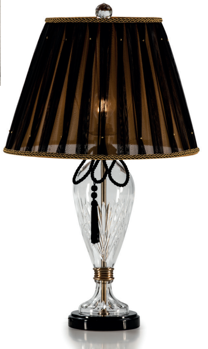
C - 3244 Ø 45 ↑ 74