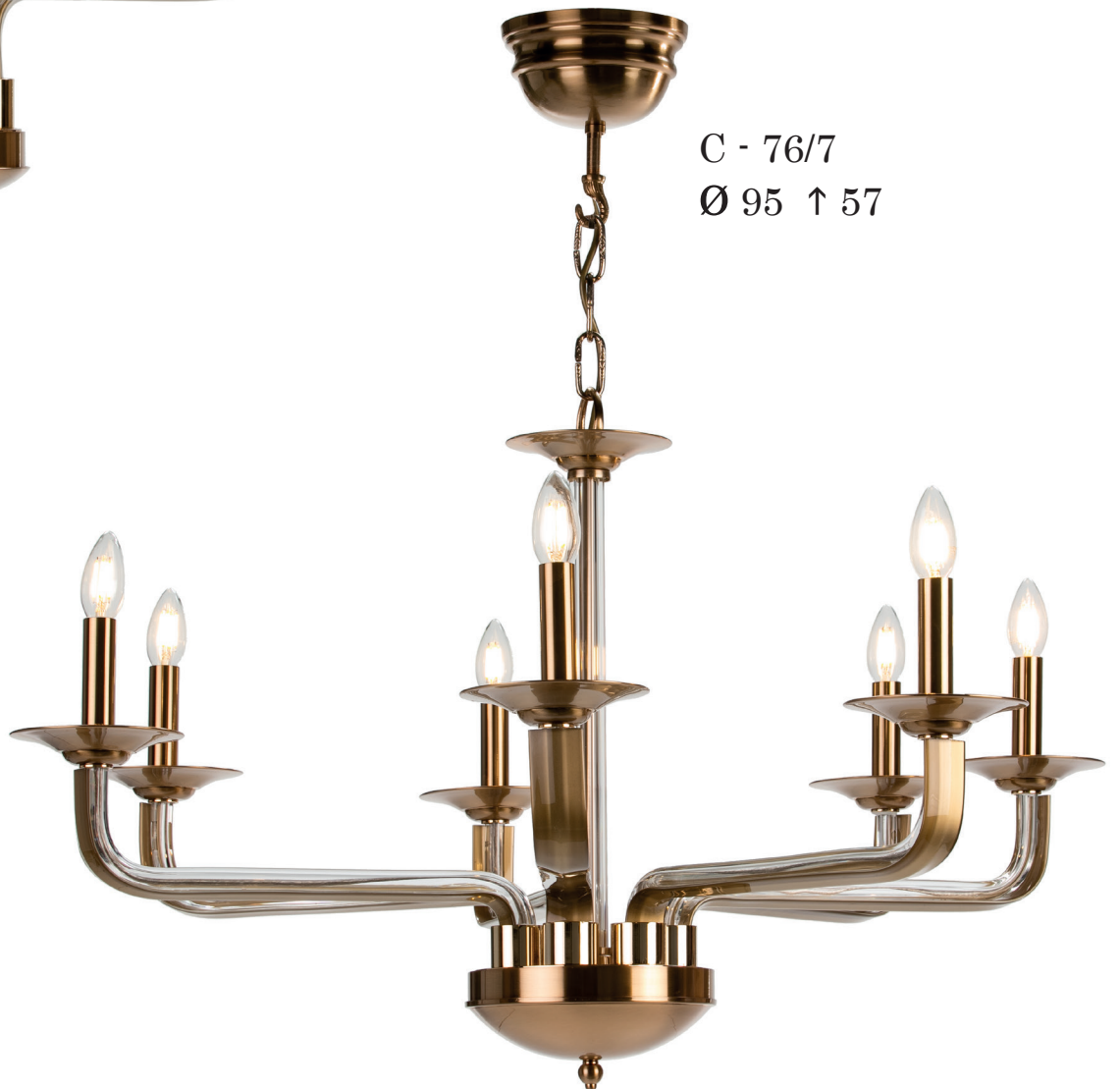
C - 76/7 Ø 95 ↑ 57