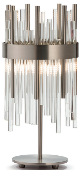
C - 329/4-S Ø 21 ↑ 48