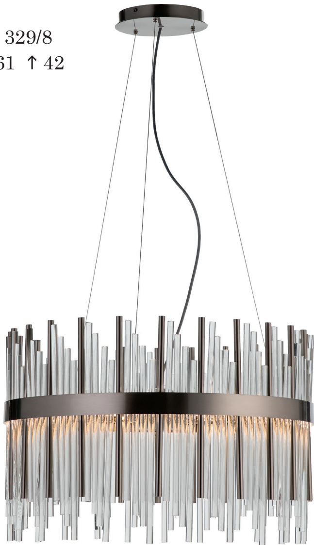
C - 329/8 Ø 61 ↑ 42