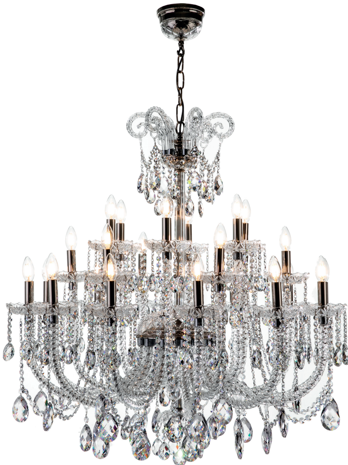
C - 74/12+6+6 Ø 96 ↑ 100