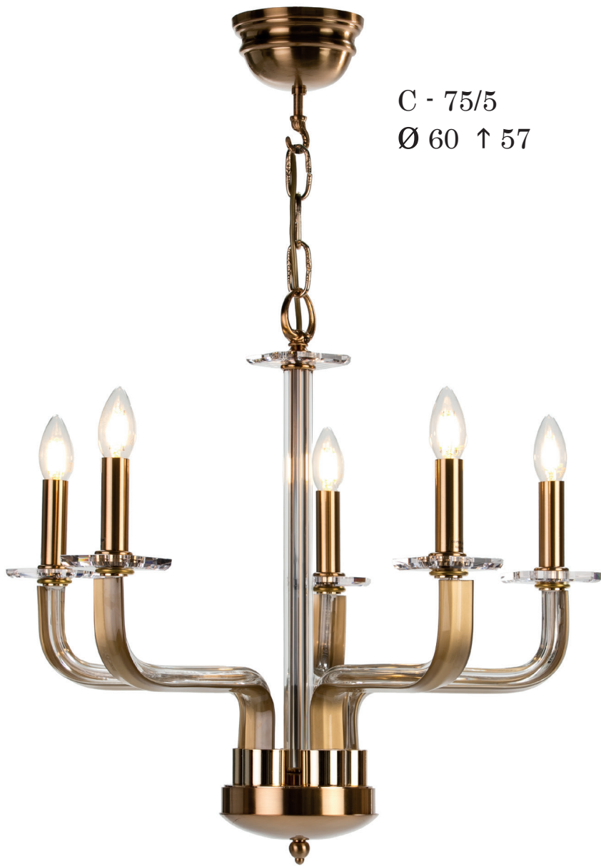
C - 75/5 Ø 60 ↑ 57